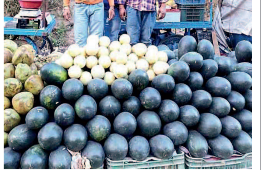
कवर्धा। लगातार बढ़ रही गर्मी के साथ नगर के बाजार में बढ़ी मौसमी और रसीले फलों की आवक।